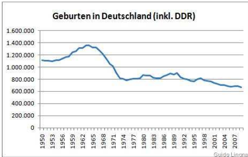
Geburten in Deutschland, Quelle: Statistisches Bundesamt.

Den relativ vielen Berufseinsteigern stehen derzeit relativ wenige Neurentner gegenüber. Denn zwischen 1942 und 1947 wurden durch den eskalierenden Weltkrieg und den Entbehrungen nach Kriegsende nur sehr wenige Kinder in Deutschland geboren. Wie die folgende Grafik deutlich zeigt, gibt es derzeit noch einmal ein relativ kurzes Zeitfenster, in dem die Zahl der erwerbsfähigen Altersgruppen steigt. Spätestens ab dem Jahr 2016 wird sich das wieder ändern und der Druck auf die Rentenkassen nimmt wieder zu. Die Erhöhung des Renteneintrittsalters ist dann dringend notwendig.“